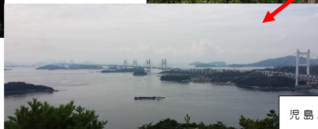
児島/鷲羽山展望台より