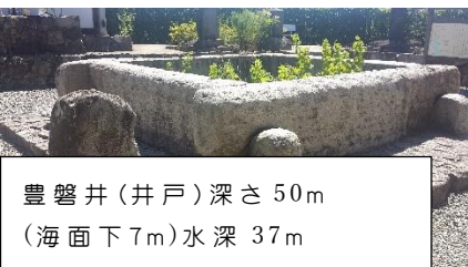
豊磐井(井戸)深さ 50m (海面下7m)水深 37m