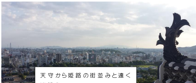
天守から姫路の街並みと遠く淡路島