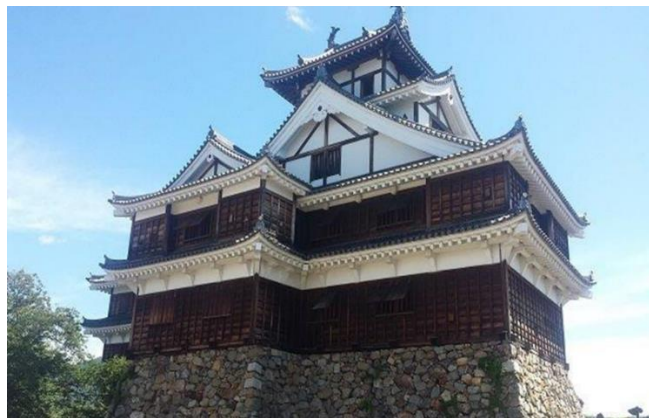
標高 35m市内からも見えます

織田信長の命で中国攻めで山陰道からの進軍で丹波の国を平定して築城したのが福知山城。市民が再建した城として2016年に名城として認定されたり、将棋の名人戦が城で初めて開催されたり大河ドラマの舞台と昨今話題性が多い城。天空の城として有名な竹田城は福知山～JR山陰本線で約45分ほど、同じ京都府です。